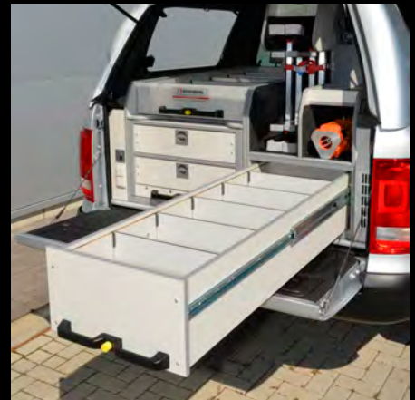
Optionaler zusätzlicher Auszug statt des 4-fach Stativschrank