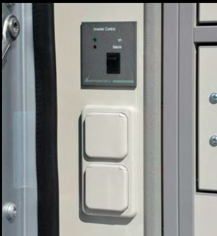
Strompaket mit Zusatzbatterie, Wechselrichter, Ladegerät als Option