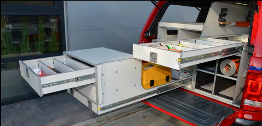
Schwerlastauszüge im neuen Design nutzen die Tiefe der Ladefläche perfekt. Hinter dem ausziehbaren Schubladenschrank lagern die Gerätekoffer.