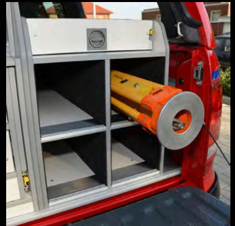
Stativschrank für 4 Stative, Kleinteileauszug darüber