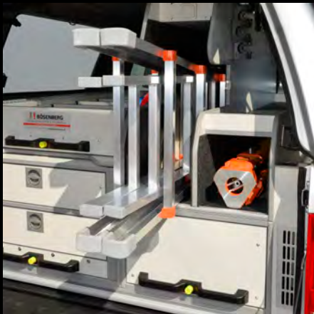
Ein Stativschrank plus ein Leiterfach als alternative Konfiguration