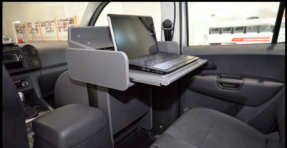
Großer Laptop-Arbeitsplatz statt des Beifahrersitzes im Fahrerhaus. Lieferung inkl. Steckdose und LED-Arbeitsleuchte (Voraussetzung: Strompaket)