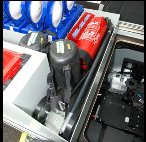
Stauraum vorne und Zugang zur Funkanlage