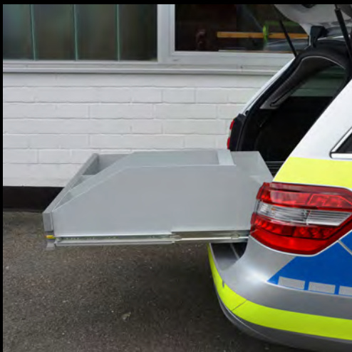
150 kg Schwerlastauszug mit Vollauszug