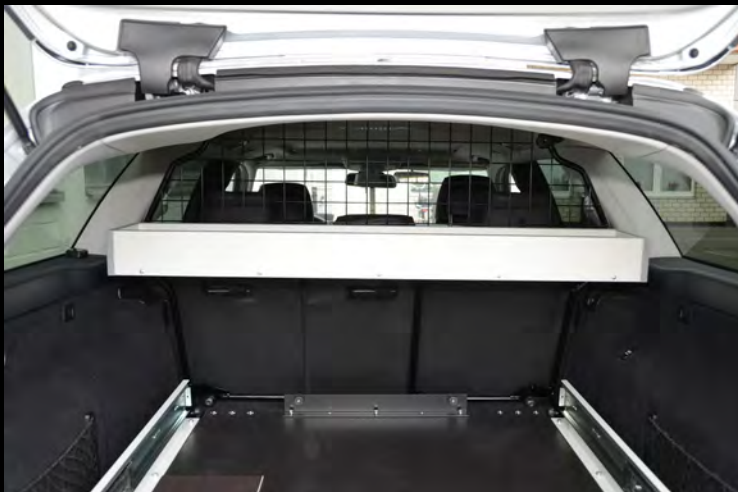
Zusätzliche Ablage am Schutzgitter