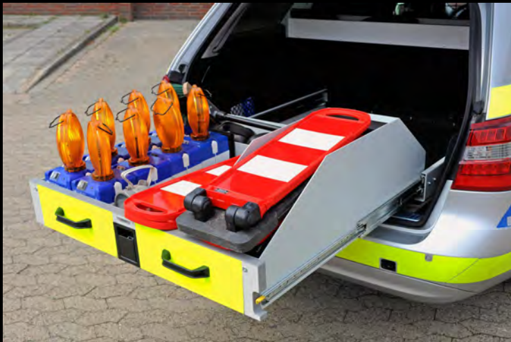
Auszug mit Beladung