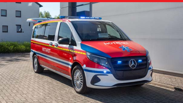
Mercedes-Benz eVito Tourer Notarzteinsatzfahrzeug NEF