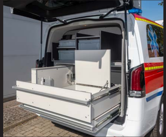
Schwerlastauszug mit elektrischer Versorgung für Defibrillator usw.