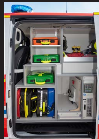
Die Notarztkoffer sind griffbereit und sicher auf der Fahrerseite verstaut.