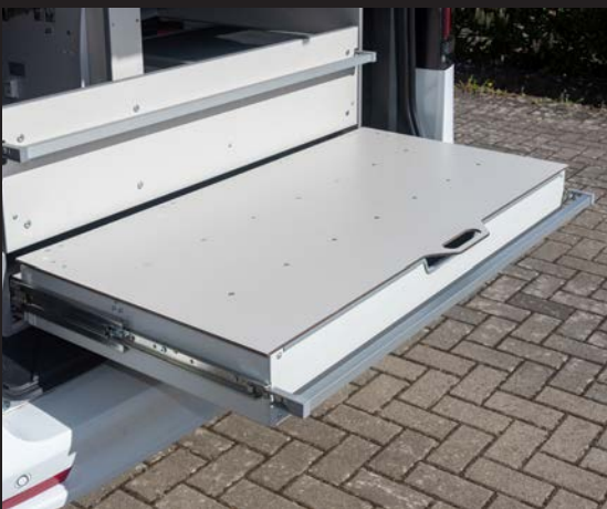
Eine ausziehbare Fläche zur bequemen Bestückung des Fahrzeugs nach dem Einsatz.