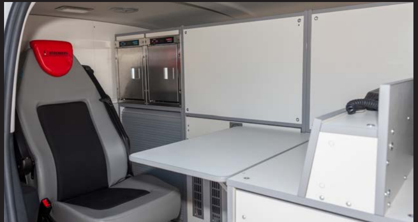
Arbeitsplatz mit Klapptisch, Wärme- und Kälteschrank.