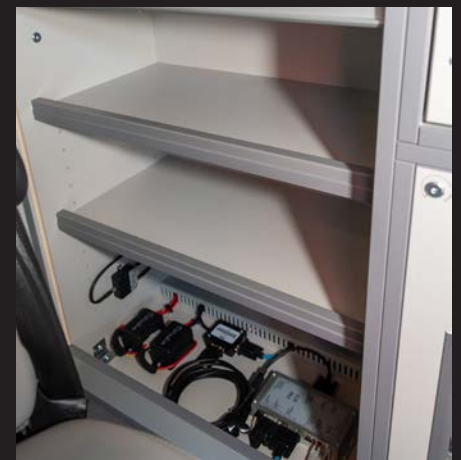
Zusätzliche Regale hinter einem Rolladen.