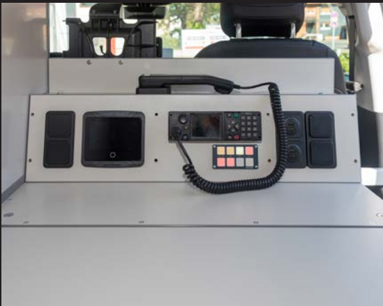
Tetra Funk-Komponenten von Sepura, bediener- und servicefreundlich verbaut.