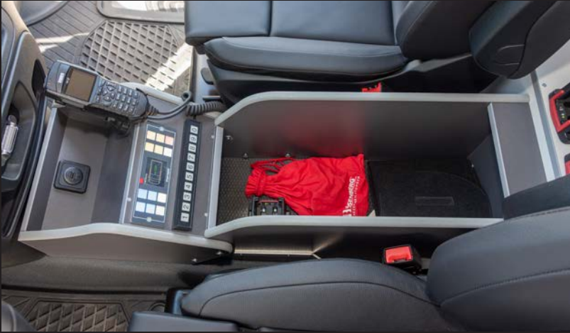
Die Mittelkonsole bietet viel Stauraum und integriert Komponenten der Steuerungs- und Kommunikationstechnik nahtlos.